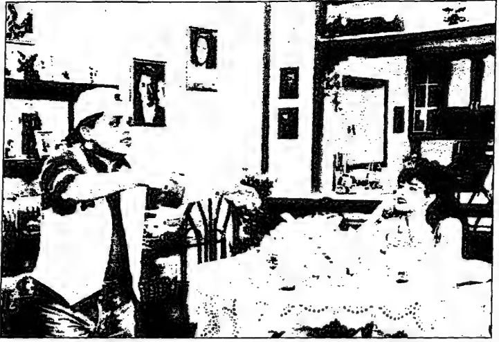
القاهرة 5- من هيام الهدي: محمد هنيدي بعد اسماعيلية رايح جاي و الأبتداء

الفتاة من هيام الهدي: محمد هنيدي بعد اسماعيلية رايح جاي و الأبتداء الفتاة من هيام الهدي: محمد هنيدي بعد اسماعيلية رايح جاي و الأبتداء